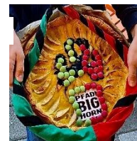
Die Kreation von mirakulix

Wir gratulieren den 3 Gewinnern herzlich – wir werden euch euren Preis sowie den Goldenen Kochhut an der nächsten Präsenz-Aktivität verleihen.