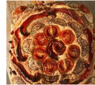
Die Kreation von baunti und smarties