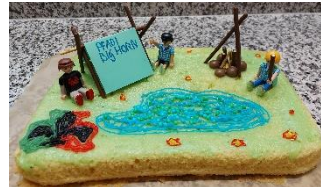
Die Kreation von helix